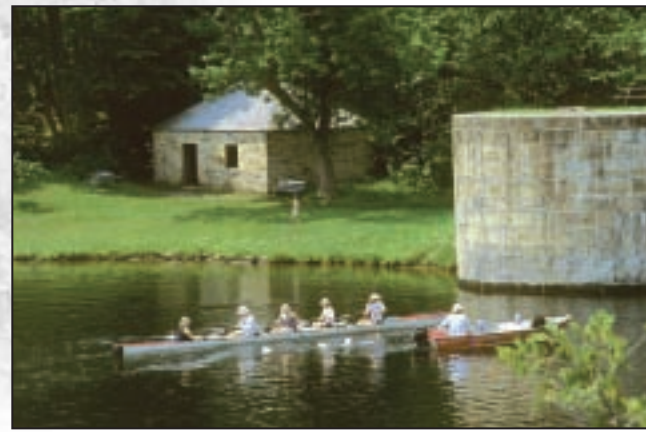
The Rideau Canal is a masterwork of human creative genius Le canal Rideau représente un chef-d'œuvre du génie créateur humain

Pour renseignements s'adresser à : Lieu historique national du Canada du Canal-Rideau 34a, rue Beckwith Sud, Smiths Falls ON K7A 2A8 (613) 283-5170 1-888-773-8888 ATS: 866-787-6221 TÉLÉC. : (613) 283-0677 Courriel : canalrideau-info@pc.gc.ca Site Web : www.pc.gc.ca