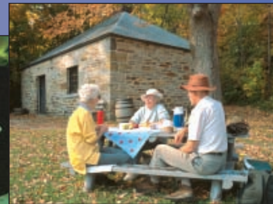
Picnicking at Jones Falls Un pique-nique agréable à Jones Falls

Careful water management is crucial to safe boating and the abatement of serious flooding. The Rideau system relies on natural rivers, lakes and 19km of