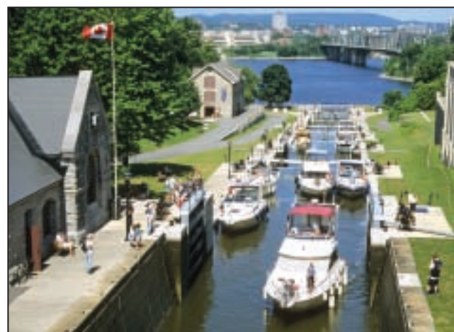
Échelle de huit écluses à Ottawa Flight of eight locks at Ottawa

La construction du canal Tay, qui a été greffé au canal Rideau, a été entreprise par des colons dynamiques de Perth. Lié par cinq écluses en bois, il faisait la jonction avec le canal Rideau en 1834 et permettait à Perth de participer à la vie commerciale du Haut-Canada. Il a été plus tard remplacé par un nouveau canal.