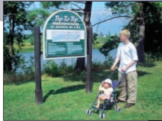
Walk the trail at Burritts Rapids Explorez le sentier à Burritts Rapids

The Rideau Canal was conceived in the wake of the War of 1812. It was to be a war-time supply route providing a secure water route for troops and supplies from Montreal to reach the settlements of Upper Canada and the strategic naval dockyard at Kingston.