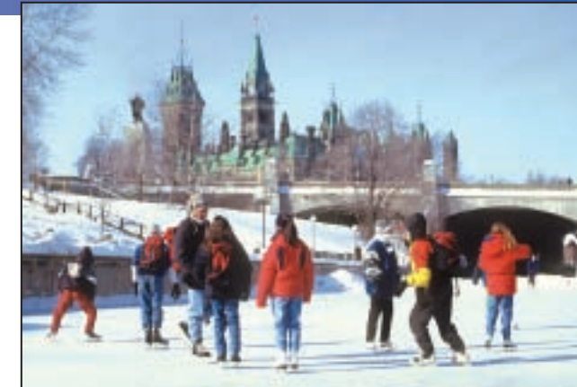
La patinoire la plus longue au monde The world's longest skating rink

À partir de Kingston, 14 écluses hissent les embarcations sur une hauteur de 50 mètres jusqu'à Newboro, au lac Upper Rideau. À partir du lac Upper Rideau, 31 écluses permettent aux bateaux de descendre 83 mètres pour atteindre la rivière des Outaouais. À partir du lac Lower Rideau, enfin, deux écluses élèvent les embarcations de 7,6 m jusqu'au niveau du canal Tay.