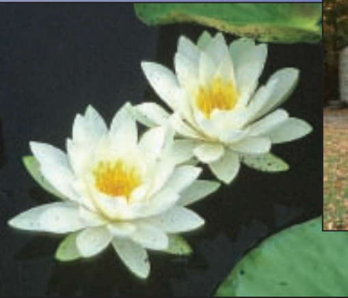
Natural Splendour Splendeur naturelle

From Lake Ontario at Kingston, the Rideau begins its ascent of the Cataraqui River system. It passes through the Cataraqui Marsh, an extensive wetland