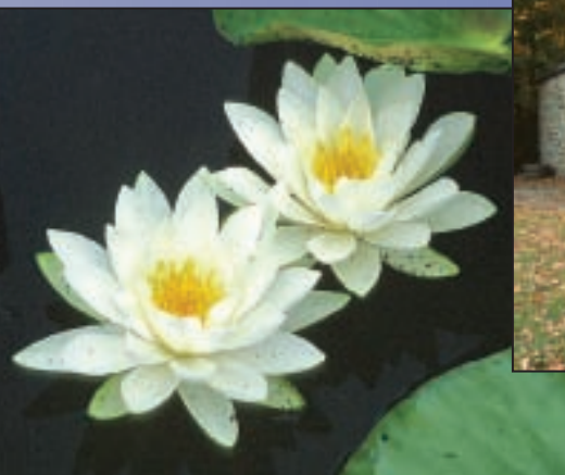
Natural Splendour Splendeur naturelle

From Lake Ontario at Kingston, the Rideau begins its ascent of the Cataraqui River system. It passes through the Cataraqui Marsh, an extensive wetland