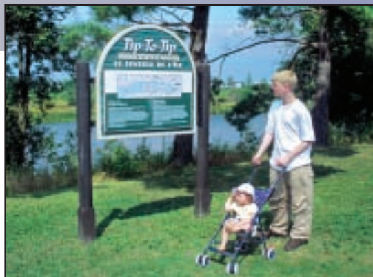
Walk the trail at Burritts Rapids Explorez le sentier à Burritts Rapids

The Rideau Canal was conceived in the wake of the War of 1812. It was to be a war-time supply route providing a secure water route for troops and supplies from Montreal to reach the settlements of Upper Canada and the strategic naval dockyard at Kingston.